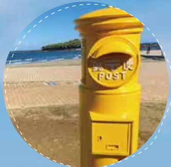
#幸せの黄色いポスト#青島