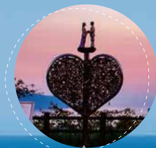
#愛宕山#鍵かけモニュメント