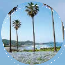
#金が浜#ネモフィラ

平均気温、日照時間、快晴日数、どれも全国トップクラスのあったか宮崎には、真っ青で広く高い空と、どこまでも透き通る海、豊かな自然に育まれた、美しい「ふるさと」があります(ご飯もめっちゃうまい!)。そんな「日本のひなた」宮崎から、あなたらしく、地域に愛される医師をめざそう。