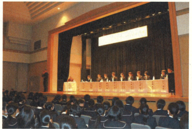
前回の講演会 (H25年11月30日)